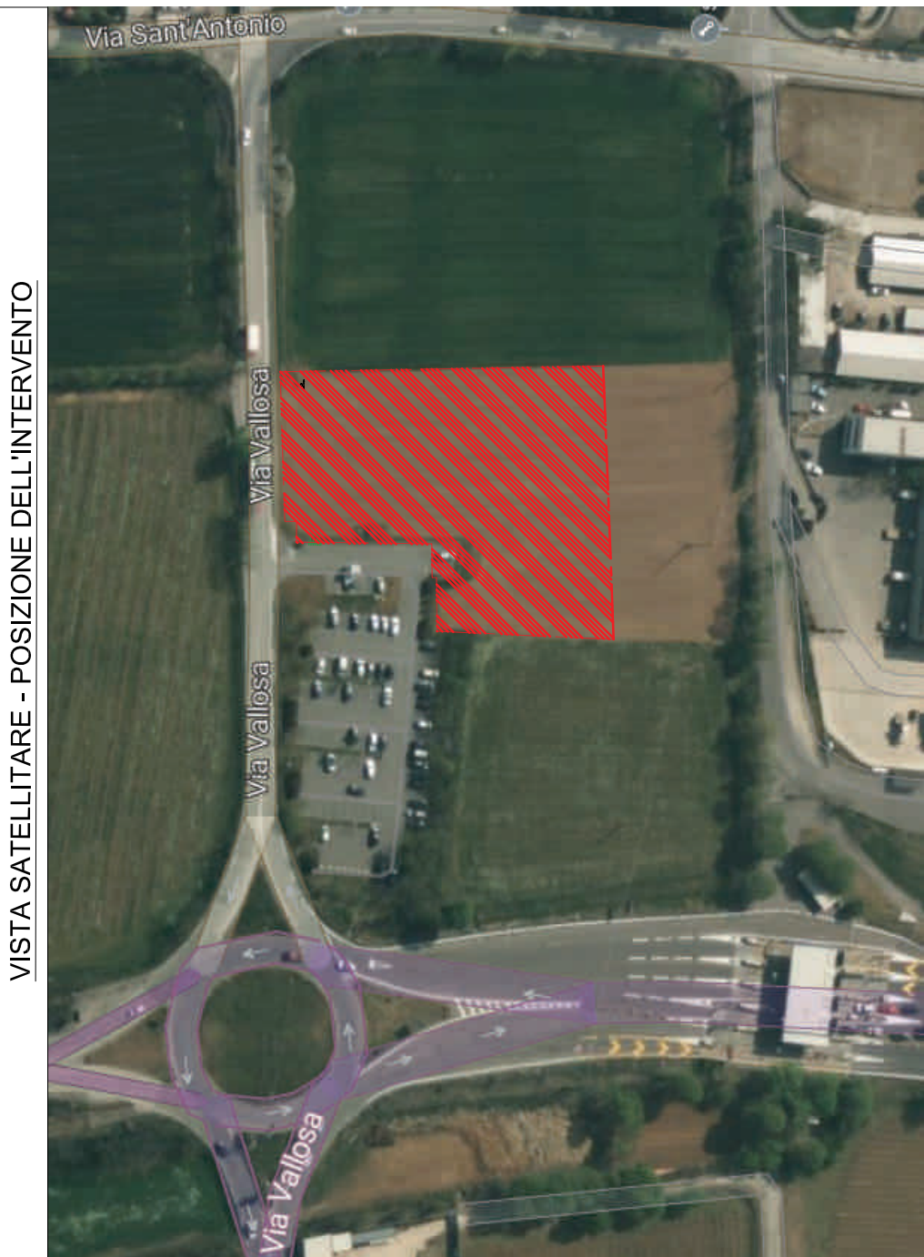
VISTA SATELLITARE - POSIZIONE DELL'INTERVENTO